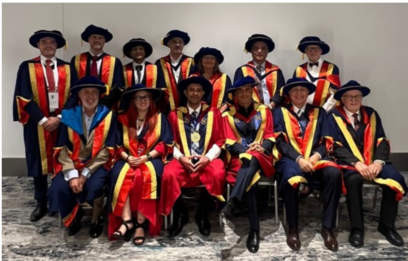
Comité Ejecutivo UIP 2022-2025